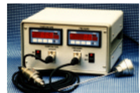
Módulos de carbónico