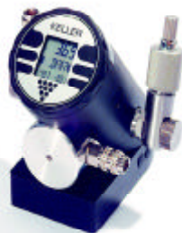
Base del calibrador LP

(*): La descripción de todas estas funciones se encuentra en el catálogo general KELLER.