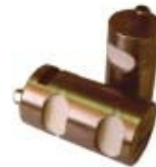
Cuadro de cotas a rellenar : Bench mark chart to fill up :