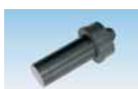
Sensor TU 810