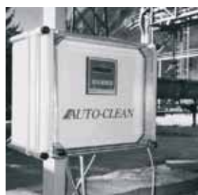
Controlador TU 7685 montado con compresor de aire