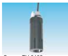
Sensor TU 8182